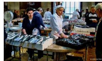
Fischhalle in RIJEKA

Am 4. Tag erfolgte die Rückreise; zuerst mit dem Bus nach RIJEKA, wo wir die Industrie- und Verwaltungsstadt besichtigten, die zur Zeit der Monarchie zweigeteilt - in einen ungarischen und österreichischen Teil - war und FIUME (=Fluss) hieß, was aber auch die kroatische Bezeichnung RIJEKA bedeutet.