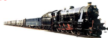
Luxus auf Schienen - B&B Blue Train B&B Dampflokomotiven Betriebsgesellschaft m. b. H