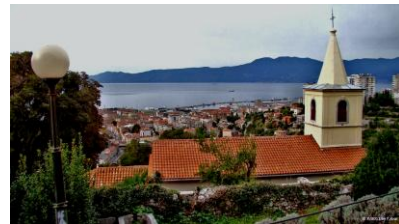
Blick auf die KVARNER-Bucht

Versorgung unseres leiblichen Wohls an Bord die Küstenorte, wie LOVRAN udgl. von See aus beobachten konnten.